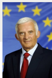
Prof. J. Buzek: